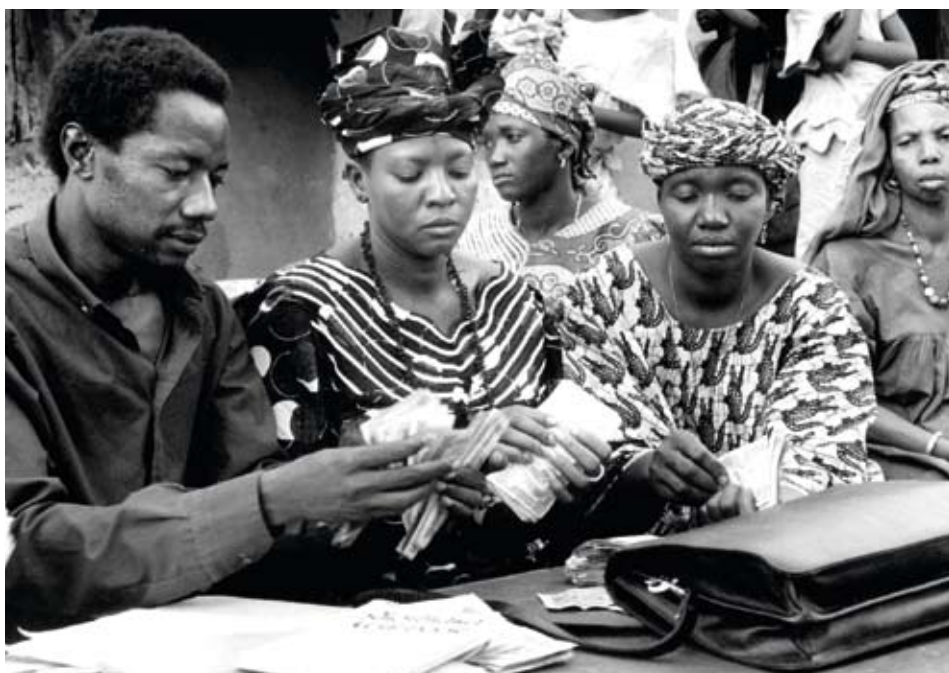
Microcrédit pour femmes paysannes en Gambie.

pas s'étonner de retrouver en Guinée, en Gambie ou en Guinée Bissau, du matériel agricole subventionné par le gouvernement du Sénégal.