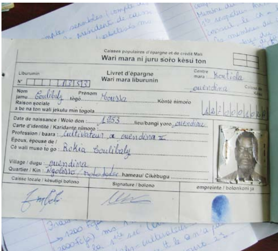
Livret d'épargne d'un paysan malien.

les ONG tenteront de mettre en place des programmes de microcrédit en zone rurale. Les Institutions de microfinance qu'ils seront amenés à créer ne résoudront cependant pas les difficultés inhérentes à la prestation de services financiers dans des zones reculées, où la rentabilité agricole dépend de la saisonnalité des productions. Le secteur financier ne suivra pas l'évolution des réalités agricoles.