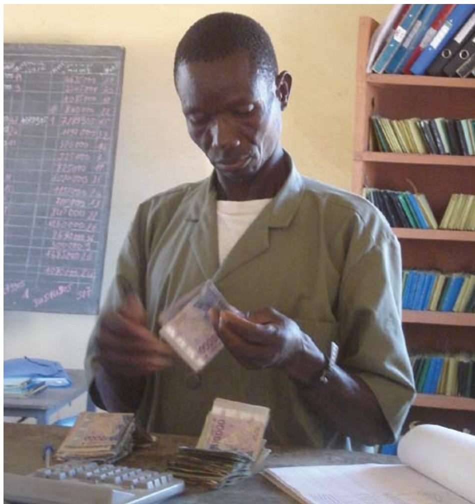
Au Mali, à la caisse centrale de Kafo Jiginew.