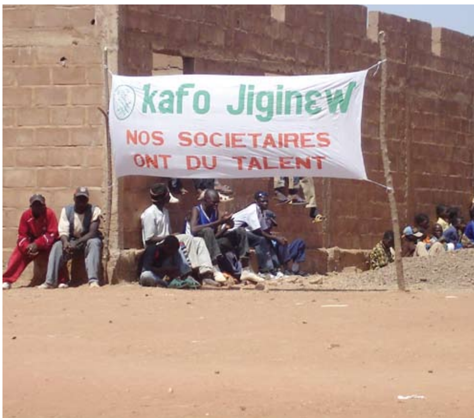
A Koutiala, au Sud-Mali, près du siège de Kafo Jiginew.