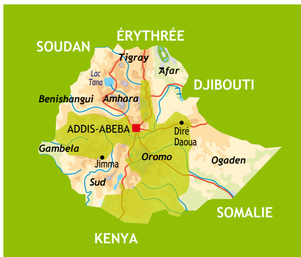
La région d'Oromo en Éthiopie.