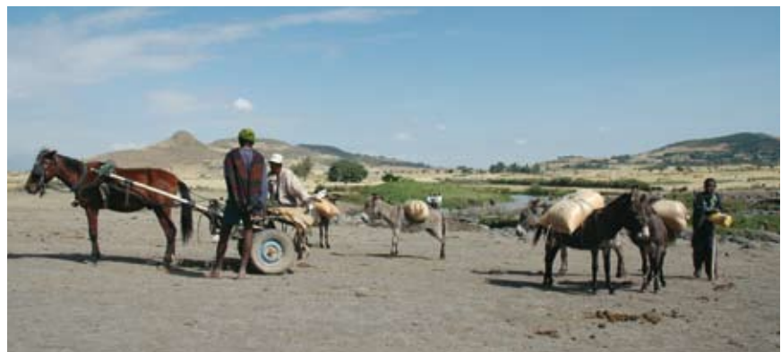
En région Oromo, de nombreuses zones sont très isolées

Basée dans la région Oromo au cœur de l'Éthiopie, l'institution de microfinance Buusaa Gonofaa a reçu en 2008 le prix européen de la microfinance pour sa mise au point d'un outil d'accompagnement social, la « poverty scorecard », qui lui permet d'offrir un meilleur service à ses clients. Cependant, c'est à un autre chantier développé par l'IMF que ce numéro de ZOOM MICROFINANCE est consacré : l'expérience relative à la mise en place de caisses rurales d'épargne et de crédit dans une zone isolée de la région Oromo.