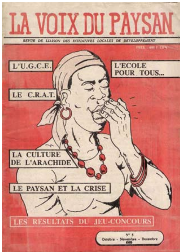
Deux couvertures des débuts de La Voix du Paysan.