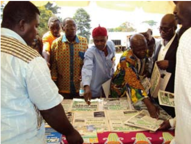
LVDP/TFV participent aux manifestations du monde agricole pour se faire connaître.

villages se heurteront non seulement à la question des responsabilités (État, ONG, etc.), mais aussi à celle du financement.